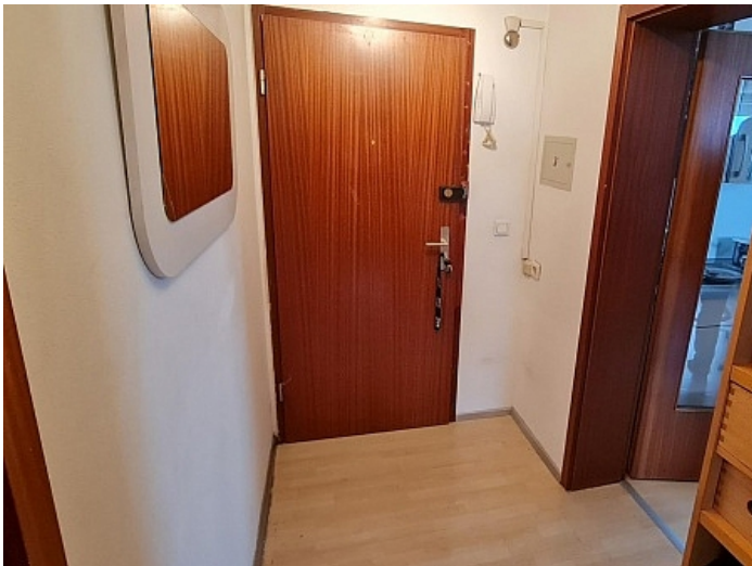
Gepflegte 3 Zi Wohnung in der Billrothstrasse