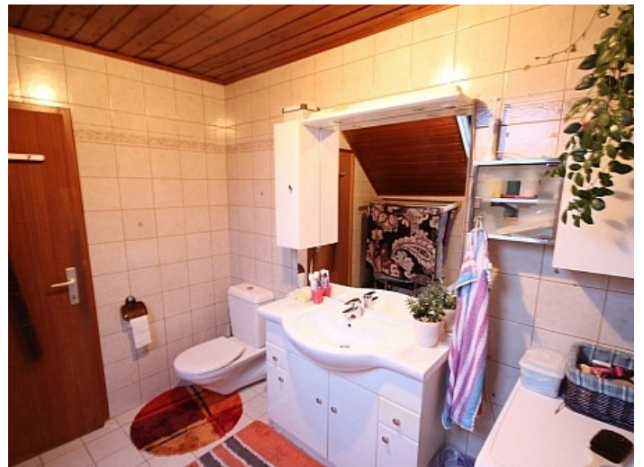
Gepflegte 3 Zi Wohnung in der Billrothstrasse