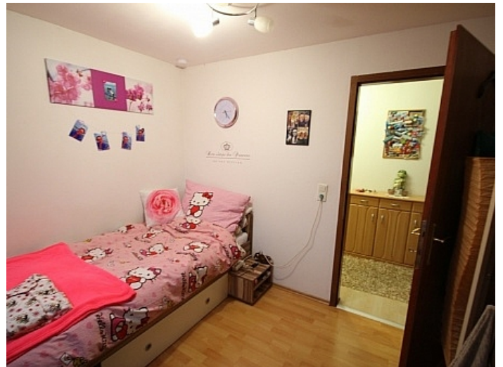
Gepflegte 3 Zi Wohnung in der Billrothstrasse