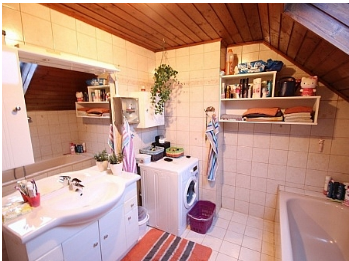
Gepflegte 3 Zi Wohnung in der Billrothstrasse