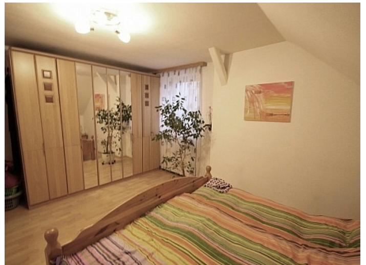
Gepflegte 3 Zi Wohnung in der Billrothstrasse