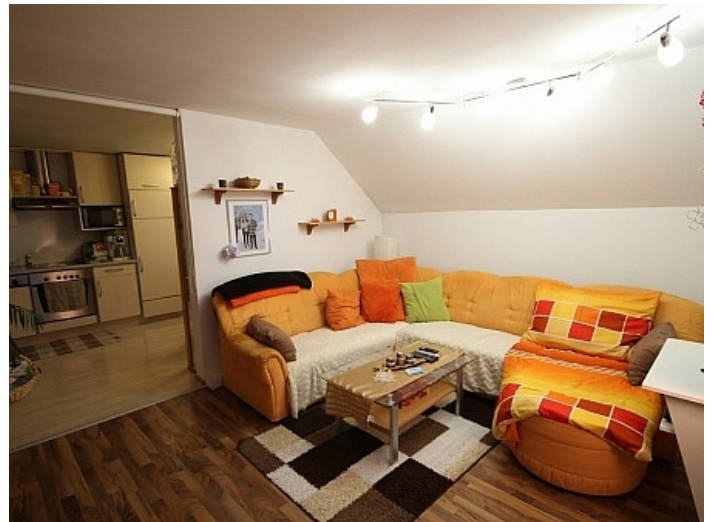
Gepflegte 3 Zi Wohnung in der Billrothstrasse