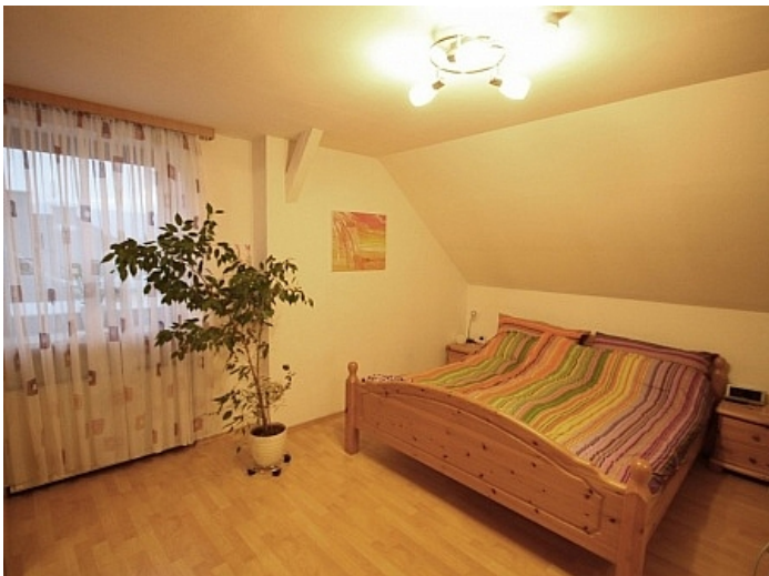
Gepflegte 3 Zi Wohnung in der Billrothstrasse