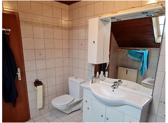
Gepflegte 3 Zi Wohnung in der Billrothstrasse