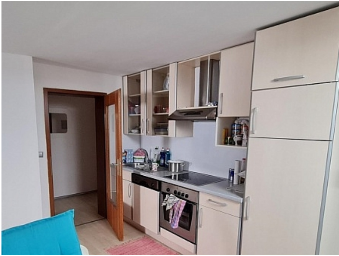
Gepflegte 3 Zi Wohnung in der Billrothstrasse