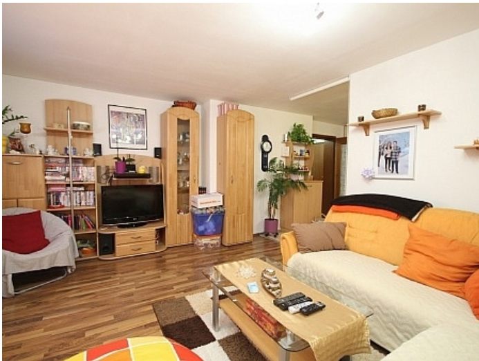
Gepflegte 3 Zi Wohnung in der Billrothstrasse