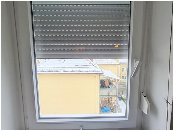
Gepflegte 3 Zi Wohnung in der Billrothstrasse